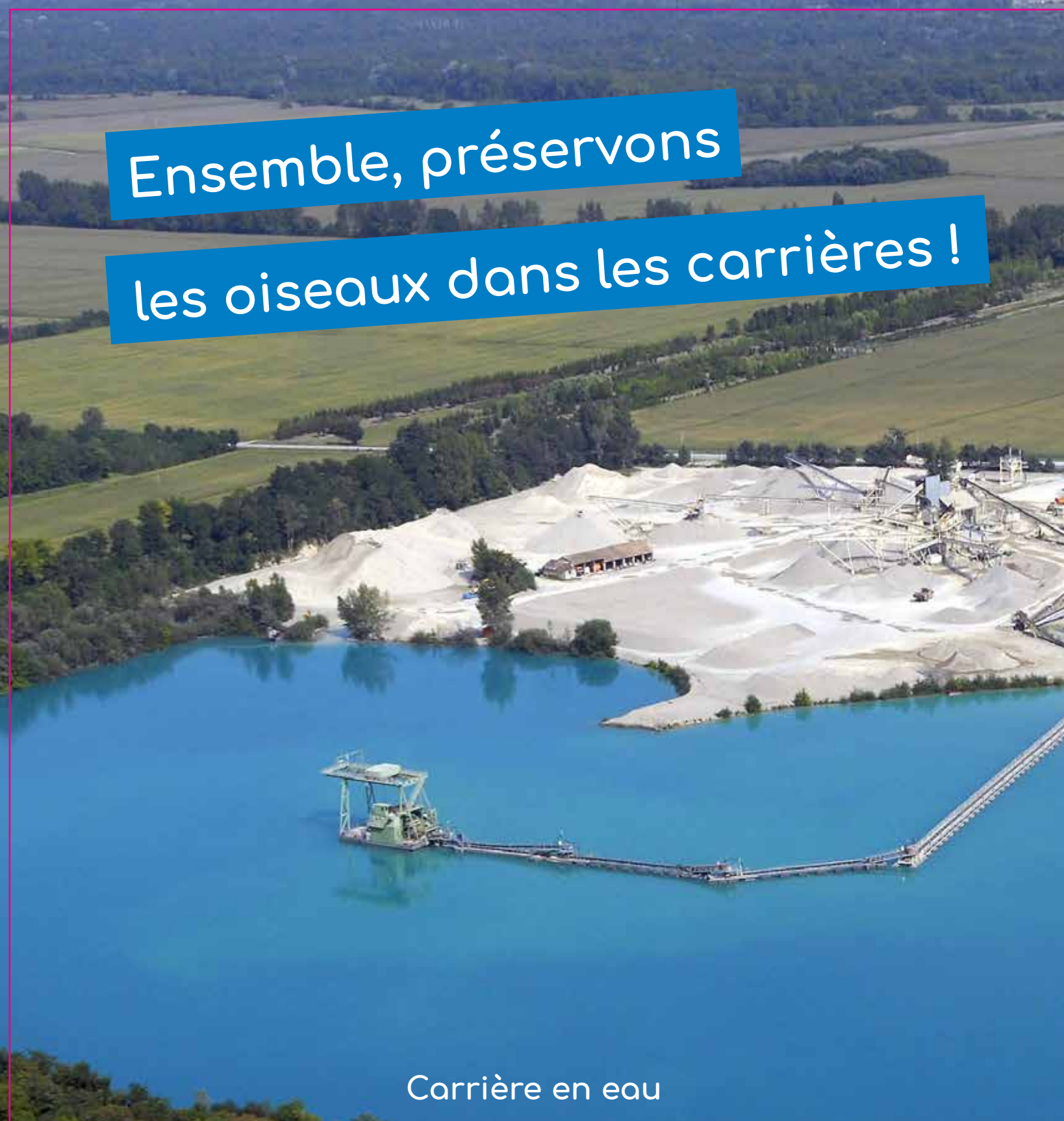
Carrière en eau