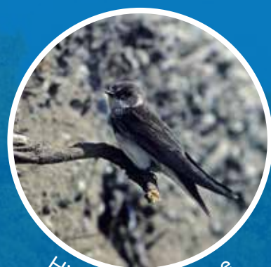
Hirondelle de rivage