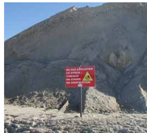
Une bonne pratique mise en place par les carrières

CARRIÈRES ET MATÉRIAUX DU GRAND OUEST IMERYS CERAMICS France LAFARGEHOLCIM BÉTONS - Agence Bretagne