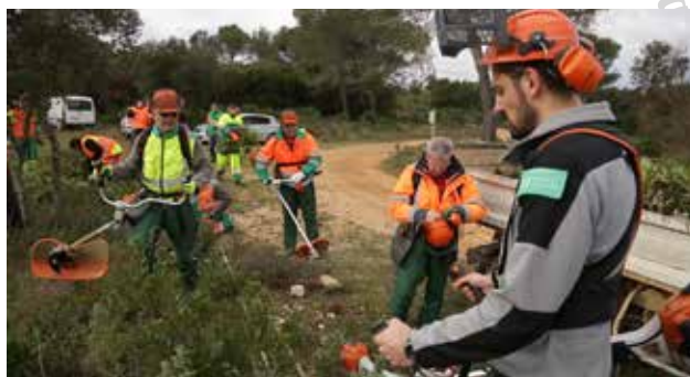
Bien équipés pour un bon débroussaillage, sans oublier les EPI !

Toujours en partenariat avec le Conservatoire d'Espaces Naturels Languedoc-Roussillon (CEN LR), ce chantier fut organisé à Sanilhac-Sagriès (30), le 24 février dernier, sur la Réserve Naturelle Régionale des Gorges du Gardon. Cette réserve se situe au cœur des gorges à une dizaine de kilomètres