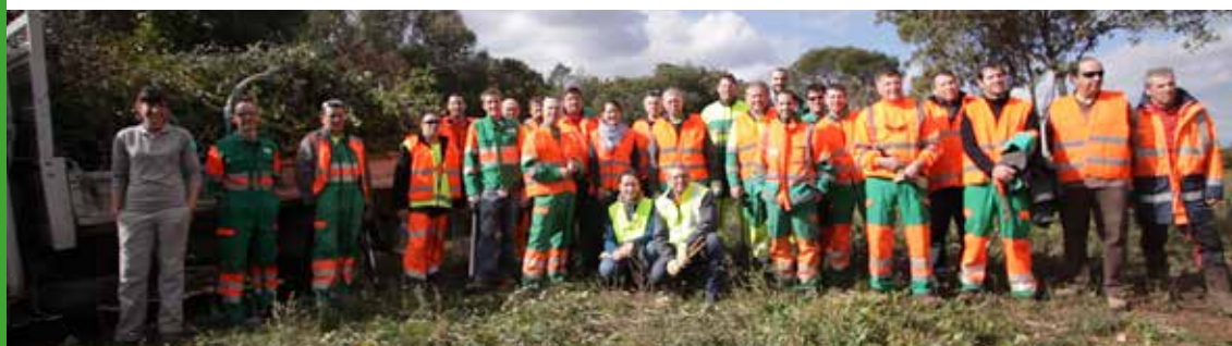
Une équipe de choc !

Ces espèces herbacées demandant un espace ouvert, ce chantier nature consistait à rouvrir le milieu en débroussaillant et en coupant tous les végétaux ligneux (arbres et arbustes). Une vingtaine de carriers ont ainsi « prêté main forte » guidés par deux salariés de la Réserve Naturelle, le temps d'une journée. Un don en nature pour l'Environnement.