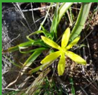
Gagée de Granatelli