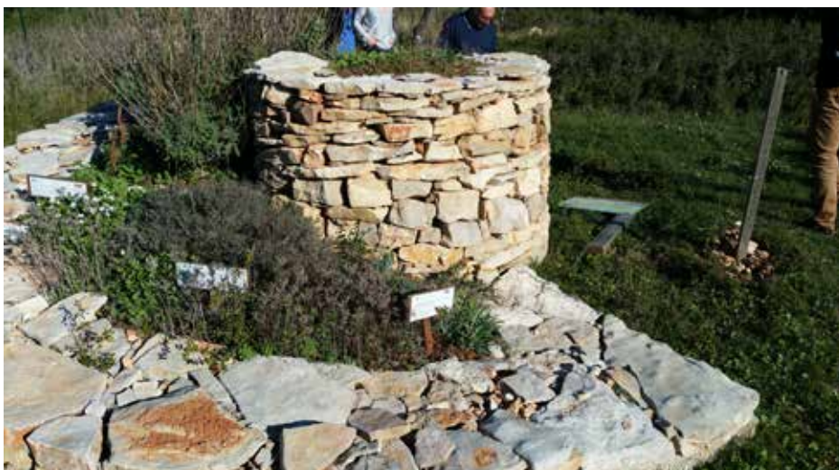
Spirale aromatique servant de refuge pour la petite faune (lézards, insectes, araignée, escargots,...)

Après un déjeuner convivial autour d'un foodtruck, l'après-midi fut réservée à des interventions des sociétés Arcade (présentation du logiciel Mentol) et Valorhiz (présentation de solutions de végétalisation en carrière).