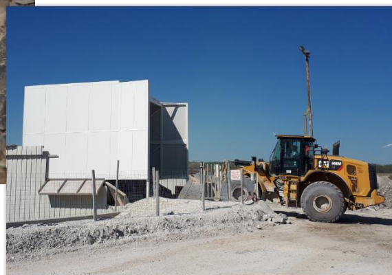
Bardage acoustique de la trémie primaire - 2021