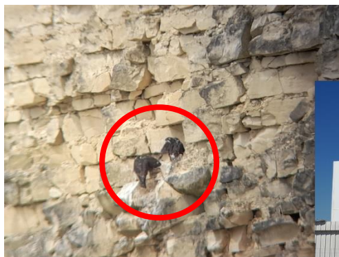
Niché de Faucons pèlerin sur un front