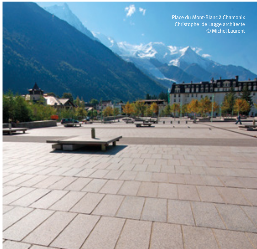
Place du Mont-Blanc à Chamonix Christophe de Lagge architecte

Beaucoup de choses restent à faire... avec votre aide !