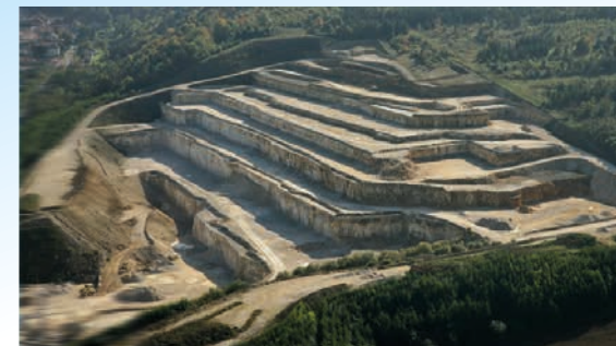
Carrière MEAC - MAXEY SUR VAISE (55)