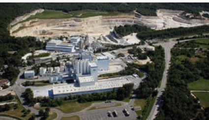
Usine et carrière OMYA - ORGON (13)

Aussi, le développement durable, la biodiversité, l'accès à la ressource, la réglementation santé-sécurité, la fiscalité... sont des thèmes suivis de façon régulière par le SN Craie.