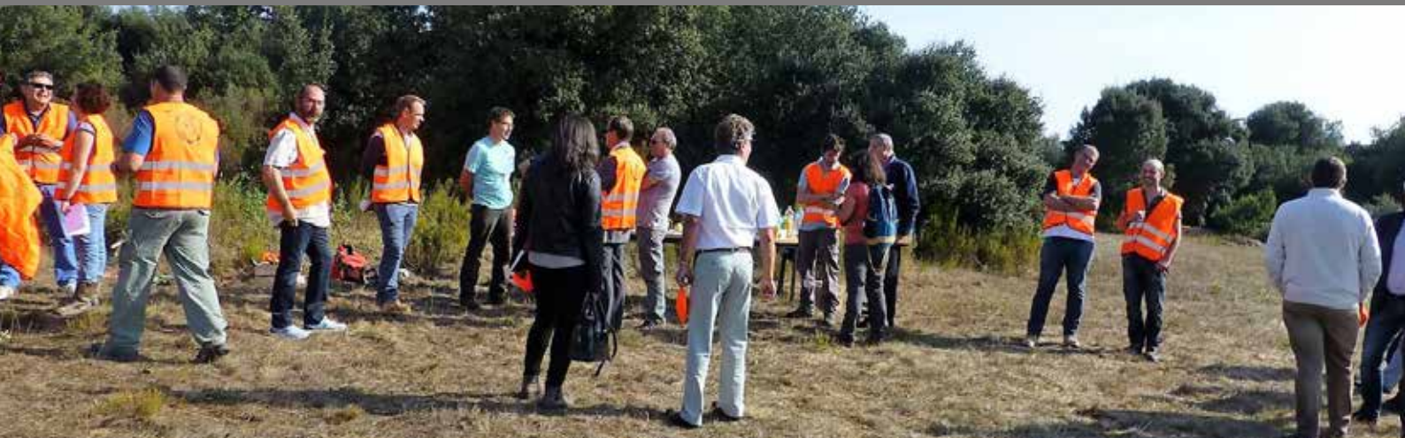
Arrivée des élus sur le chantier nature