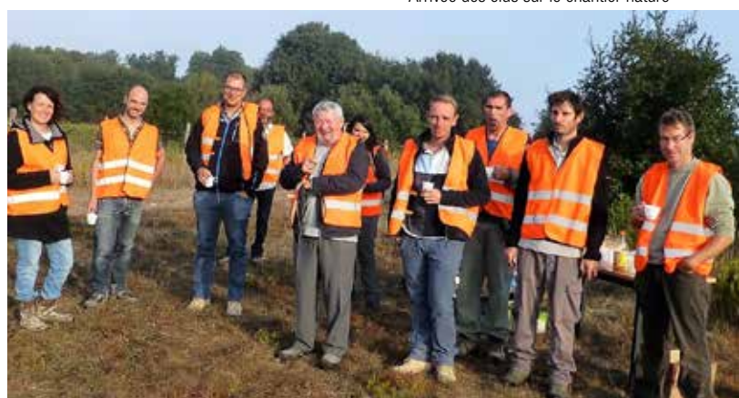
L'équipe de débroussaillage

En Poitou-Charentes, une quinzaine de carriers, munis de sécateurs et cisailles se sont retrouvés, le 28 septembre 2018 pour un « chantier nature » sur la commune de Saint-Savinien (17).