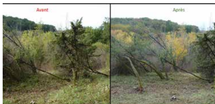
Les résultats de ce travail collectif