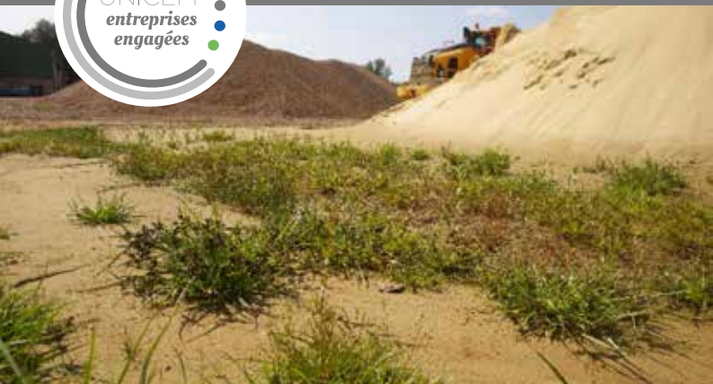
Le Souchet brun, espèce patrimoniale