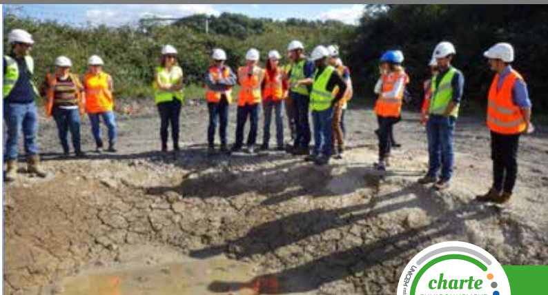
Visite d'une carrière wallonne avec la FEDIEX