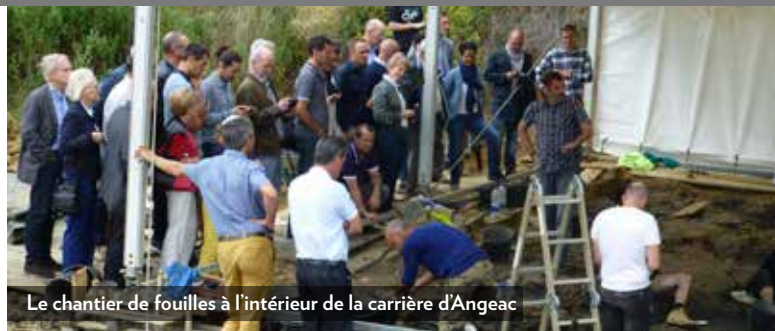
Le chantier de fouilles à l'intérieur de la carrière d'Angeac

Culture et bonne humeur ont été les maîtres mots de cette journée. Pour rappel, contrairement au mobilier ou restes anthropique qui sont protégés, les fossiles ne peuvent être sauvegardés qu'à la discrétion de l'exploitant et de sa volonté de partenariat avec les scientifiques. Ces exemples rappelés dans cette exposition sont le témoignage de collaborations réussies entre carriers et paléontologues.