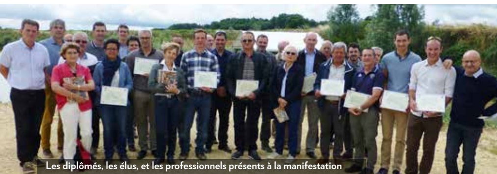
Les diplômés, les élus, et les professionnels présents à la manifestation