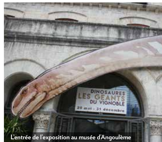
L'entrée de l'exposition au musée d'Angoulême