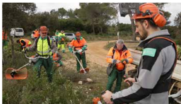
Chantier nature dans les Gorges du Gardon (30) – Réouverture d'une pelouse sur sol sableux