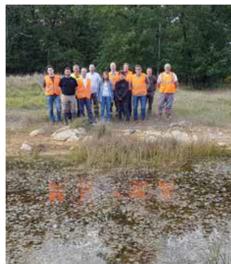
Chantier nature dans le Quercy (82) – Restauration des mares