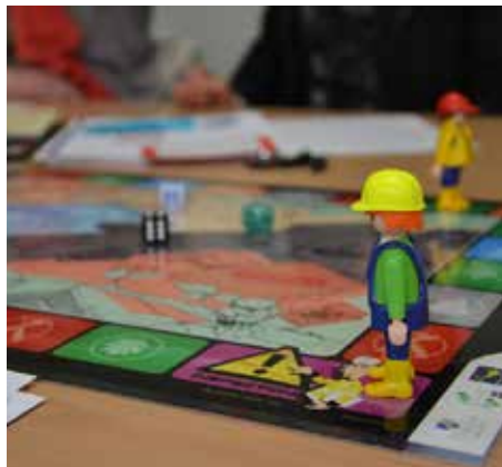
Formation « Quiz du carrier : en quête de la bonne pratique environnementale »

L'un des trois piliers de la Charte Environnement est de développer la compétence environnementale des entreprises par des formations et des actions de sensibilisation.