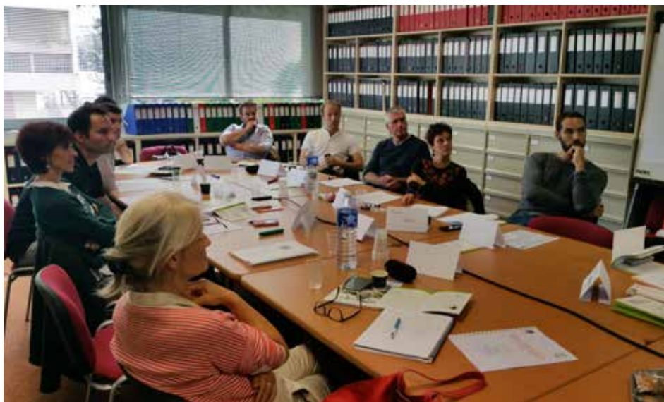
Formation « Conduire son projet de carrière en adéquation avec les attentes du territoire »

En 2016, le Comité Régional de la Charte a décidé d'organiser deux types de formations :