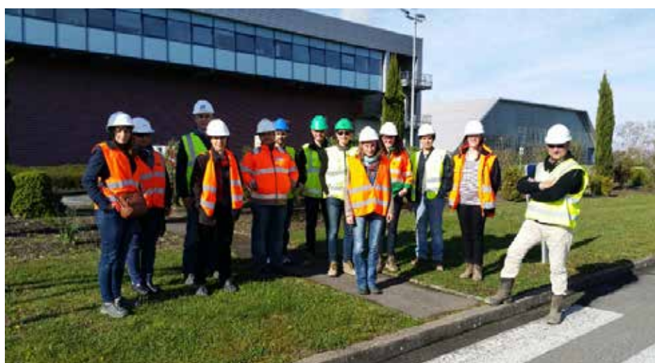
Visite du 12 avril 2016 au centre de valorisation des déchets ménagers Econôte à Bessières (31).

Depuis deux ans, la réunion est associée à une visite d'industrie différente de celles des carrières mais ayant tout autant des démarches environnementales.