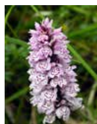
Orchis de Fuchs