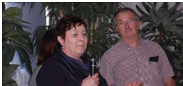
Remise de diplôme par Madame le Maire d'Oberhergheim à la société « Gravière des Elben »

Les 21 sites de carrières ayant maintenu le « niveau 4 » entre 2014 et 2016 se sont vu remettre leur diplôme de confirmation. Une fois de plus, cette manifestation a été l'occasion de faire témoigner salariés et chefs d'entreprise quant à l'engagement environnemental de leur site et surtout, l'engagement collectif des salariés. Cette journée a également permis aux entreprises de rencontrer et d'échanger avec leurs élus, les représentants de collectivités